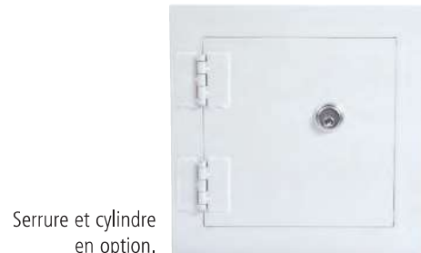
Serrure et cylindre en option.

Dimensions spéciales : Conçues en 5 jours