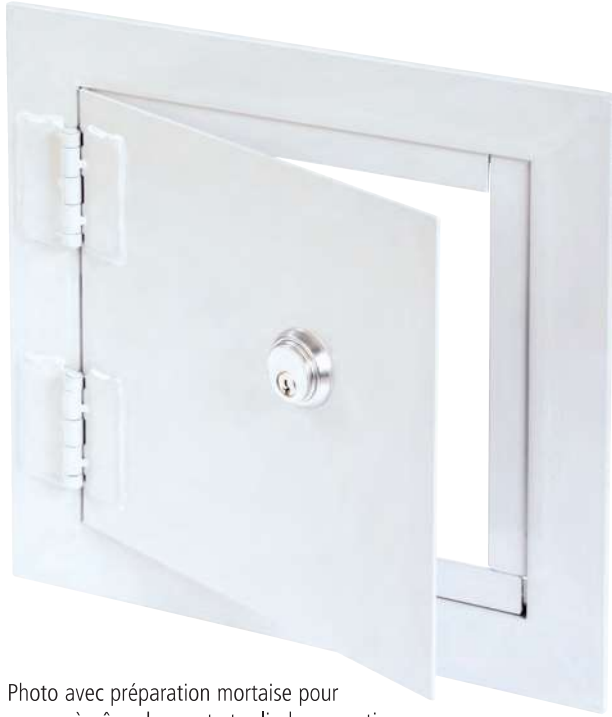
Photo avec préparation mortaise pour serrure à pêne dormant et cylindre en option.

La PHS est la solution idéale pour les endroits où la sécurité est d'une grande importance . Elle est fabriquée avec des matériaux très robustes et peut être préparée pour recevoir tous types de serrures à pènes dormants.